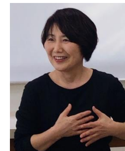
国際中医師 国際中医薬膳師 (国立北京中医薬大学日本分校卒)

薬膳師・中医師の国際資格養成講座の主宰をメインに 教室での指導に精力を注ぐ一方、婦人会、公民館講座、 保育園、小学校、中学校、各種団体などからの 講演 依頼を受け、中医学的考え方、薬膳のこと、養生の大 切さ、経絡ストレッチの実技など 多くの人にわかり やすく伝え、健康な暮らしを自分で創る事が出来る社 会をめざし活動を行っています。